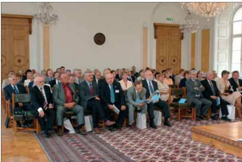
Konverentsile eelnes 20. Augusti Klubi üldkoosolek