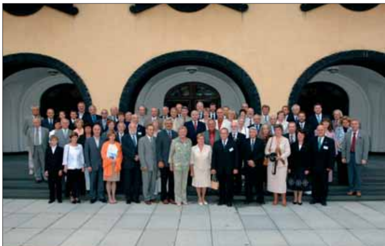
20. Augusti Klubi ühispile Riigikogu esimehe Ene Ergmaga