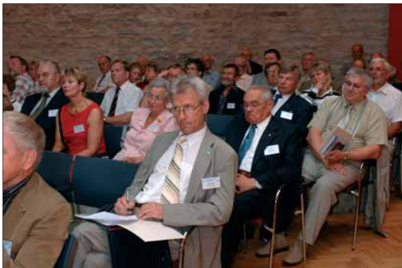
Konverentsil osalejad kuulamas ettekandeid