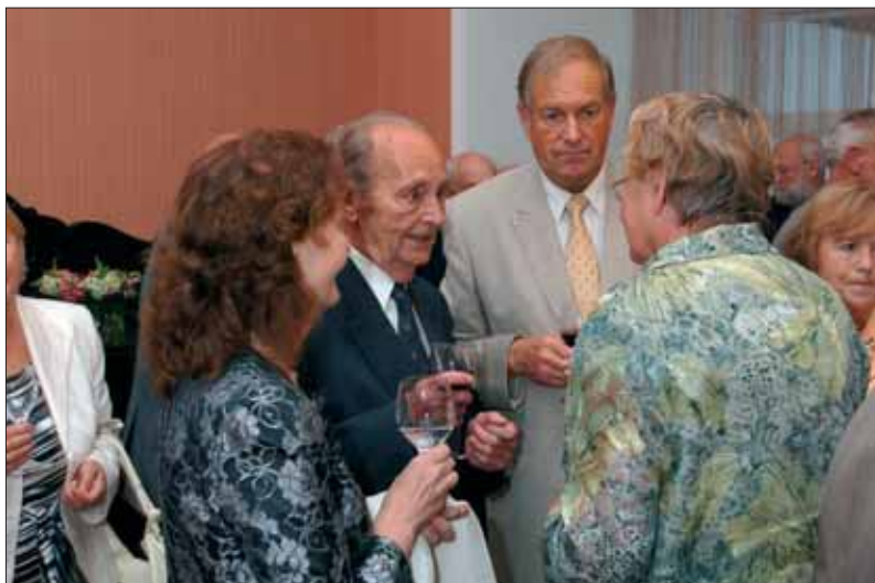
Riigikogu esimehe Ene Ergma vastuvõtt konveretsil osalejatele