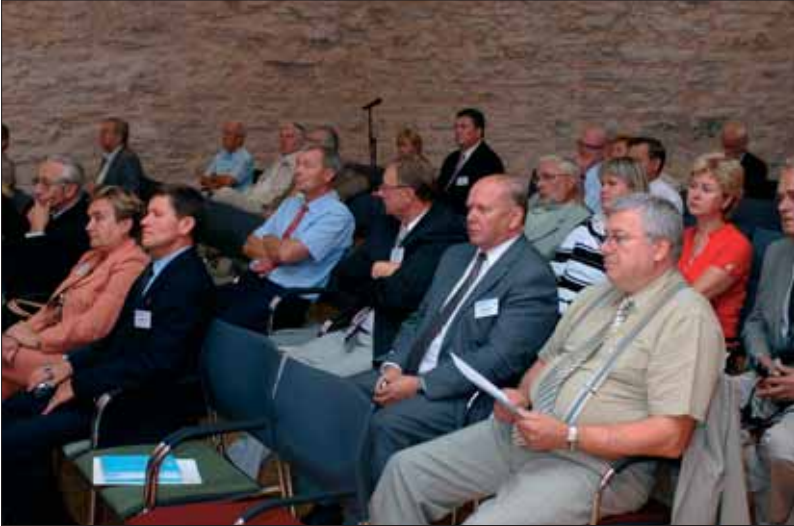
Järjekordne ettekanne on lummanud kuulajaid