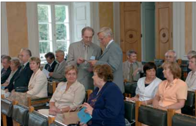
20. Augusti Klubi üldkoosolek