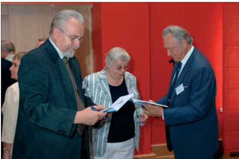
Arnold Rüütel, Marju Lauristin ja Jüri Rätsep autogramme vahetamas