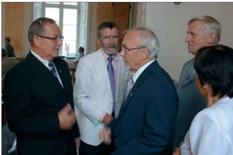
Konverentsi eel käis elav mõttevahetus