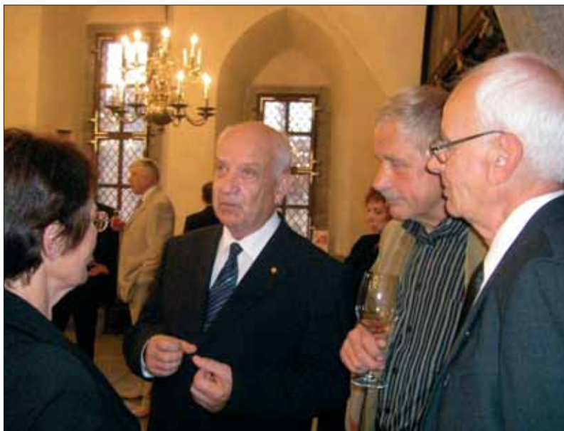
Konverentsil osalejad Tallinna linna pea vastuvõtul Raekojas