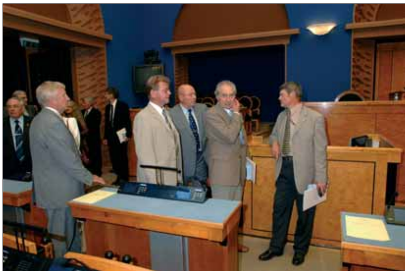
Pilk Toompea lossi istungite saali