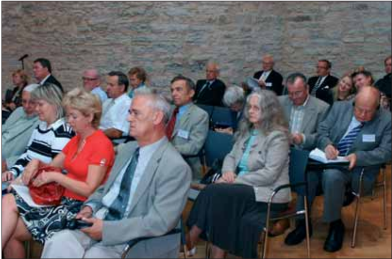
Konverentsil osalejad kuulamas ettekandeid