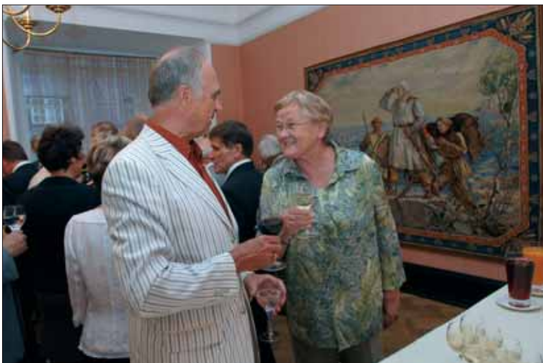
Riigikogu esimehe Ene Ergma vastuvõtt konverentsil osalejatele