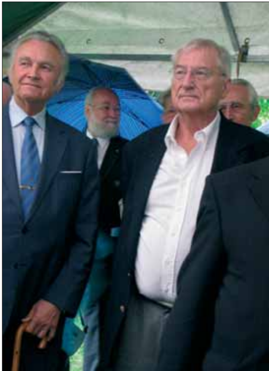
Arnold Rüütel ja Aleksander Einseln Põltsamaal Sõpruse pargis